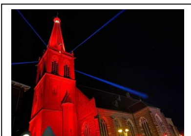
Catharinakerk verlicht in december