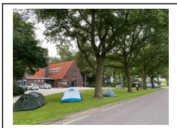
De nacht van.... afsluiting Zoom In voor de jongeren

Het vinden van ambtsdragers die een bestuurlijke overstijgende rol hebben is lastig. Gelukkig is er een nieuwe voorzitter voor de kerkrentmeesters gevonden en is de scribea bereid gevonden om nog wat langer aan te blijven. Een vacature voor voorzitter van de kerkenraad wordt verwacht.