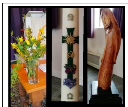
Geloken Pasen in Wehl